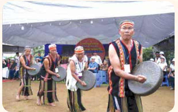
Với 49 dân tộc anh em, việc xây dựng khối đại đoàn kết toàn dân tộc là nhiệm vụ quan trọng của Mặt trận Tổ quốc các cấp tỉnh Lâm Đồng.

T hành công của Đại hội Đại biểu Ủy ban Mặt trận Tổ quốc Việt Nam tỉnh lần thứ I, nhiệm kỳ 2025-2030 không chỉ thể hiện ở việc xác định rõ mục tiêu, nhiệm vụ và giải pháp cho nhiệm kỳ tới mà còn tạo sự thống nhất về nhận thức và hành động trong toàn hệ thống Mặt trận, góp phần củng cố khối đại đoàn kết toàn dân tộc, tăng cường đồng thuận xã hội và phát huy sức mạnh của Nhân dân trong sự nghiệp xây dựng, phát triển quê hương.