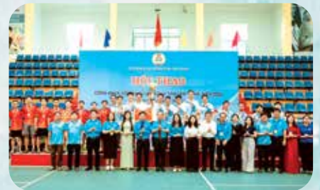
Liên đoàn Lao động tỉnh thường xuyên tổ chức hội thao dành cho công nhân viên chức tại các KCN trên địa bàn tỉnh.

T hời gian qua, việc triển khai Chỉ thị số 52-CT/TW ngày 09/01/2016 của Ban Bí thư cùng các chủ trương, chính sách của tỉnh về nâng cao đời sống văn hóa tinh thần cho công nhân lao động (CNLD) đã đạt nhiều kết quả tích cực, góp phần xây dựng quan hệ lao động hài hòa, nâng cao năng suất lao động và thúc đẩy phát triển kinh tế - xã hội.