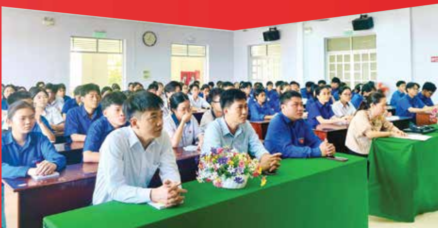
Trung tâm Chính trị phường Bình Thuận tổ chức lớp nhận thức về Đảng khóa 4 năm 2026, dành cho học sinh trường trung học phổ thông ở các phường, xã.

dạy của Trung tâm chính trị xã, phường, đặc khu; Quyết định số 156-QĐ/TU ngày 29/10/2025 về Quy chế phối hợp giữa đảng ủy cấp xã nơi có trụ sở trung tâm chính trị với các đảng ủy cấp xã trong lãnh đạo, chỉ đạo công tác của trung tâm chính trị (TTCT) xã, phường, đặc khu; văn bản đã xác định rõ nguyên tắc, nội dung, trách nhiệm và phương pháp phối hợp trong tổ chức bồi dưỡng lý luận chính trị, cập nhật kiến thức, kỹ năng, nghiệp vụ cho cán bộ, công chức, viên chức, đảng viên, đoàn viên, hội viên ở cơ sở. Ban Tổ chức Tỉnh ủy ban hành Hướng dẫn số 02-HD/BTCTU, ngày 12/11/2025 về một số nội dung thực hiện Quy định số 360-QĐ/TU, ngày 29/8/2025 của Ban Bí thư về chức năng, nhiệm vụ, tổ chức bộ máy của TTCT xã, phường, đặc khu thuộc tỉnh, quy định rõ tiêu chuẩn giảng viên chuyên trách, giảng viên kiêm nhiệm; yêu cầu về trình độ chuyên môn, lý luận chính trị, nghiệp vụ sư phạm, kỹ năng truyền đạt và kinh nghiệm thực tiễn. Đội ngũ giảng viên kiêm nhiệm được lựa chọn từ các đồng chí cấp ủy viên, lãnh đạo các cơ quan, đơn vị, mặt trận, đoàn thể các cấp, góp phần tăng tính thực tiễn