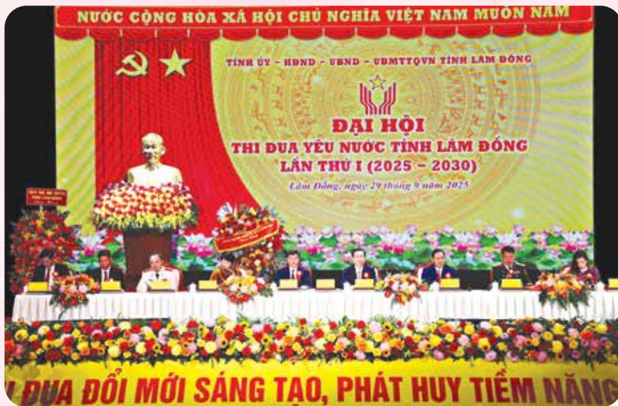
Đại hội thi đua yêu nước tỉnh Lâm Đồng lần thứ 1 (giai đoạn 2025-2030).

Tinh thần xuyên suốt của Chỉ thị số 09 là hướng mạnh về cơ sở, lấy người dân làm trung tâm và mục tiêu phục vụ. Các phong trào thi đua phải lan tỏa sâu rộng trong Nhân dân, chú trọng vùng sâu, vùng xa, vùng đồng bào dân tộc thiểu số; quan tâm người lao động trực tiếp và các lực lượng tuyến đầu. Qua đó, góp phần nâng cao chất lượng cuộc sống của Nhân dân, củng cố niềm tin và sự đồng thuận xã hội.