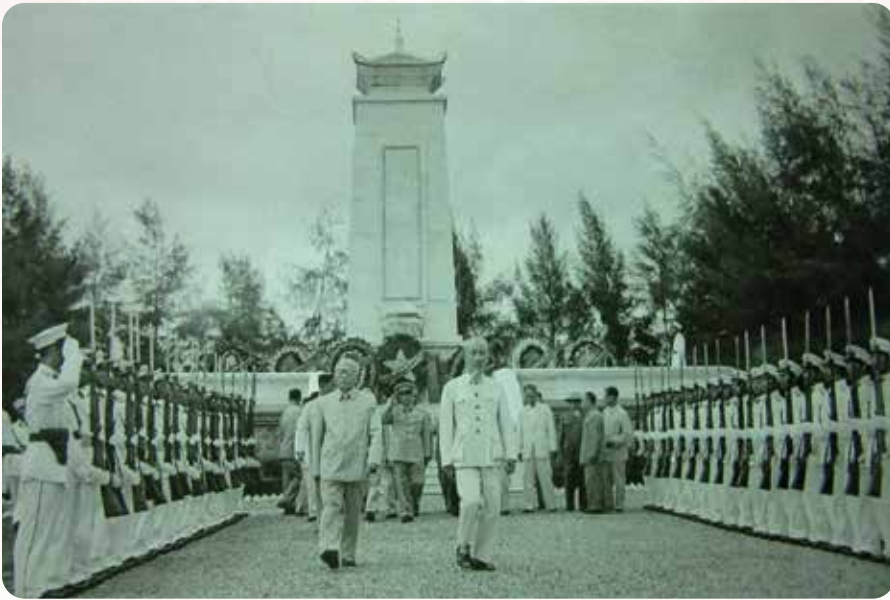
Ngày 02/9/1955, Bác Hồ cùng các đồng chí lãnh đạo Đảng, Nhà nước tới đặt vòng hoa viếng các liệt sĩ tại Nghĩa trang Mai Dịch, Hà Nội.