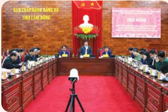
Quang cảnh hội nghị.

Đối với các chỉ tiêu theo Kế hoạch của Ban Thường vụ Tỉnh ủy, đến nay, tỉnh đã hoàn thành 30/55 chỉ tiêu, trong đó có 14 chỉ tiêu vượt kế hoạch đề ra.