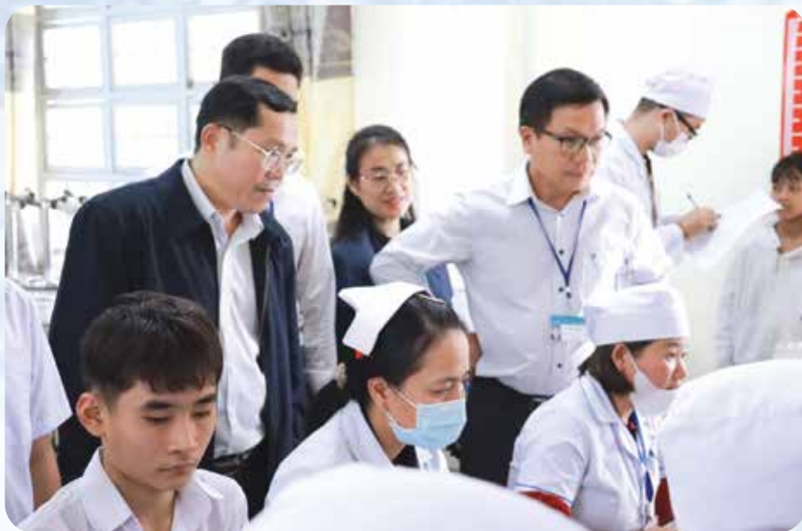
Ngành Y tế Lâm Đồng tăng cường kiểm tra, giám sát nhiệm vụ khám sức khỏe định kỳ hoặc khám sàng lọc miễn phí cho người dân trên địa bàn tỉnh.

Việc tổ chức khám sức khỏe định kỳ hoặc khám sàng lọc miễn phí cho người dân là bước cụ thể hóa Nghị quyết số 72-NQ/TW ngày 09/9/2025 của Bộ Chính trị về một số giải pháp đột phá tăng cường bảo vệ, chăm sóc và nâng cao sức khỏe Nhân dân trong tình hình mới. Chủ trương này thể hiện sự chuyển hướng từ tư duy tập trung điều trị bệnh sang