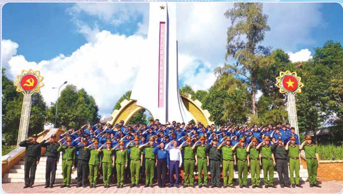
Tuổi trẻ Lâm Đồng lan tỏa khí thế sôi nổi Chiến dịch Thanh niên tình nguyện hè năm 2026.

người dân sử dụng dịch vụ công trực tuyến, thanh toán không dùng tiền mặt và tiếp cận các nền tảng số. Đồng thời, thanh niên còn tham gia hỗ trợ chính quyền cơ sở trong số hóa dữ liệu, cải cách hành chính và xây dựng chính quyền số, thể hiện tinh thần xung kích của thanh niên xung phong trong thời đại khoa học - công nghệ.