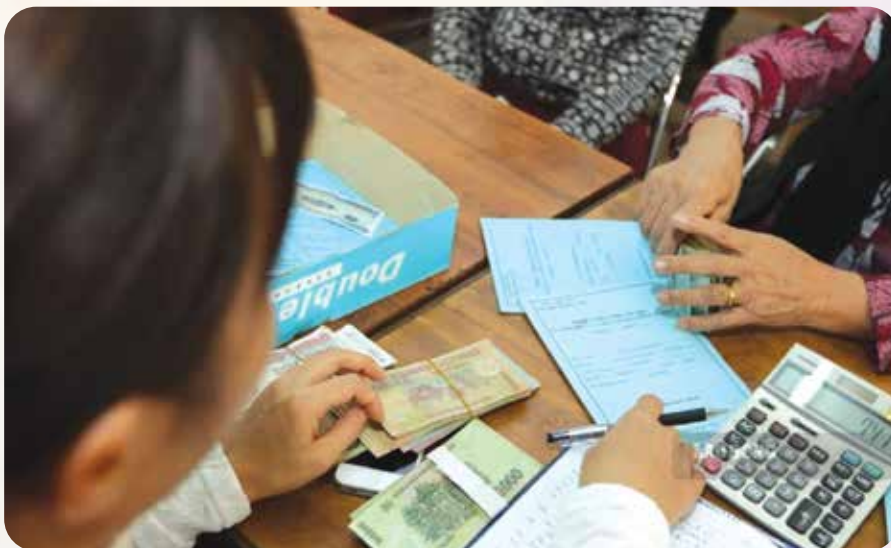
Lương cơ sở tăng từ ngày 01/7, do đó, mức đóng BHXH, BHYT có sự thay đổi.

Đối tượng đang hưởng trợ cấp tuất hằng tháng, trợ cấp phục vụ theo quy định của pháp luật về bảo hiểm xã hội trước ngày 01/7/2026 thì mức hưởng trợ cấp tuất hằng tháng từ ngày 01/7/2026 được tính theo mức lương cơ sở quy định tại Nghị định số 161/2026/NĐ-CP quy định mức lương cơ sở và chế độ tiền thưởng đối với cán bộ, công chức, viên chức và lực lượng vũ trang.