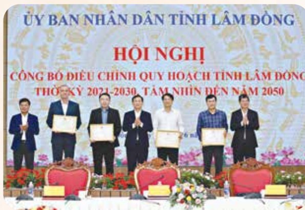
Lãnh đạo tỉnh Lâm Đồng tặng Bằng khen cho các đơn vị đóng góp xuất sắc vào việc hoàn thành tốt nhiệm vụ bước đầu trong điều chỉnh quy hoạch tỉnh.

Tỉnh sẽ phát triển các hành lang kinh tế, chuỗi giá trị liên kết vùng; phát triển kinh tế biển, logistics liên vùng.