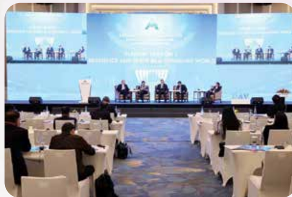
Quang cảnh phiên toàn thể 1 - Tự cường và đoàn kết trong một thế giới đang thay đổi.

Trong hai ngày làm việc, Diễn đàn đã tổ chức nhiều phiên thảo luận chuyên sâu về các vấn đề chiến lược như tăng cường tự cường và đoàn kết trong bối cảnh thế