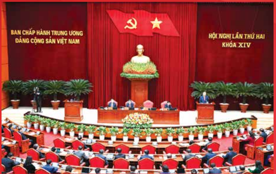
Tổng Bí thư Tô Lâm phát biểu tại phiên khai mạc Hội nghị lần thứ hai Ban Chấp hành Trung ương Đảng khóa XIV.

Ngày 01/4/2026, Ban Chấp hành Trung ương ban hành Nghị quyết số 04-NQ/TW về tăng cường sự lãnh đạo của Đảng đối với công tác phòng, chống tham nhũng, lãng phí, tiêu cực trong giai đoạn mới; điều này thể hiện quyết tâm chính trị cao của Đảng trong việc xây dựng bộ máy nhà nước thực sự trong sạch, vững mạnh, hoạt động hiệu năng, hiệu lực, hiệu quả; đồng thời khẳng định phòng, chống tham nhũng, lãng phí, tiêu cực không