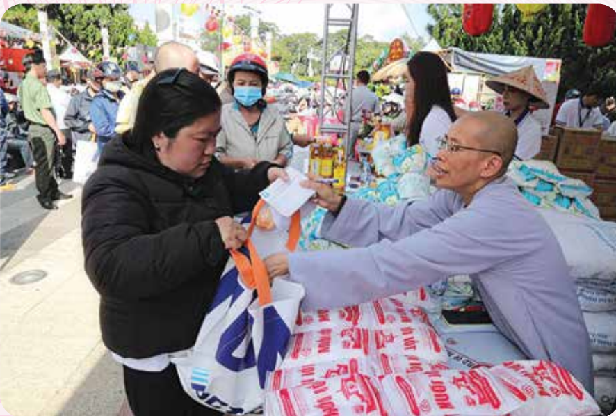
Ban Trị sự Giáo hội Phật giáo Việt Nam tỉnh tổ chức chương trình Hội chợ 0đ tại Quảng trường Lâm Viên (phường Xuân Hương - Đà Lạt).

Điểm nổi bật trong hoạt động của Phật giáo tỉnh Lâm Đồng thời gian qua là công tác