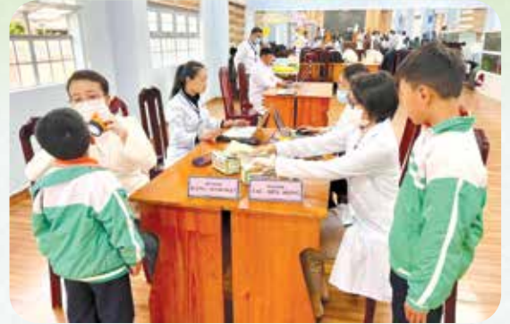
Trung tâm y tế khu vực Lạc Dương tổ chức khám sức khỏe cho học sinh trên địa bàn.

Sau 15 năm triển khai thực hiện Chỉ thị số 38-CT/TW, ngày 07/9/2009 của Ban Bí thư Trung ương Đảng về đẩy mạnh công tác BHYT trong tình hình mới, Việt Nam đã đạt được nhiều thành tựu quan trọng trong công tác bảo vệ, chăm sóc sức khỏe Nhân dân. Tỷ lệ bao phủ BHYT không ngừng được mở rộng (đạt 94,29% dân số), chất lượng khám chữa bệnh từng bước được nâng cao, quyền lợi của người tham gia ngày càng được bảo đảm.