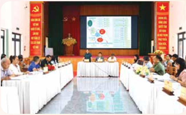
Xã Đức Trọng (Lâm Đồng) lấy ý kiến Nhân dân về việc sắp xếp, sáp nhập các thôn.

đồng thời xem xét đầy đủ các yếu tố đặc thù về lịch sử, văn hóa, phong tục, tập quán, điều kiện địa lý, quốc phòng, an ninh và sự gắn kết tự nhiên của cộng đồng dân cư, nhất là tại địa bàn miền núi, biên giới, hải đảo, vùng đồng bào dân tộc thiểu số và địa bàn có yếu tố tôn giáo; gắn với yêu cầu nâng cao hiệu quả quản trị ở cơ sở, thúc đẩy chuyển đổi số, đáp ứng yêu cầu phát triển nhanh, bền vững, mục tiêu tăng trưởng “2 con số” và nâng cao chất lượng phục vụ Nhân dân.