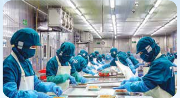
Công nhân làm việc trong các khu, cụm công nghiệp.

Công nghiệp luôn giữ vai trò là động lực quan trọng thúc đẩy tăng trưởng kinh tế, nâng cao năng suất lao động, tạo việc làm và gia tăng sức cạnh tranh của địa phương. Với tỉnh Lâm Đồng, phát triển công nghiệp không chỉ là yêu cầu khách quan của quá trình phát triển mà còn là giải pháp chiến lược nhằm khai thác hiệu quả tiềm năng, lợi thế, tạo nền tảng vững chắc để thực hiện mục tiêu tăng trưởng nhanh và bền vững trong giai đoạn mới.