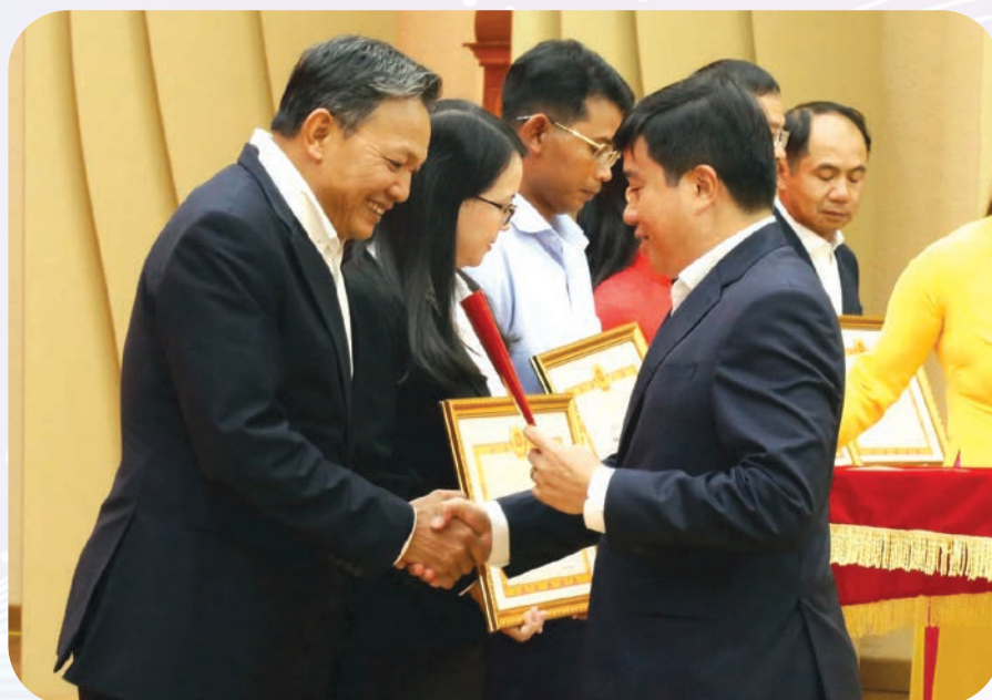
Đồng chí Bí thư Tỉnh ủy trao Bằng khen cho các tập thể có thành tích xuất sắc trong công tác tổ chức Đại hội đảng bộ các cấp và Đại hội đại biểu Đảng bộ tỉnh lần thứ I.

Tại hội nghị, Ban Thường vụ Tỉnh ủy và Chủ tịch UBND tỉnh đã khen thưởng 34 tập thể và