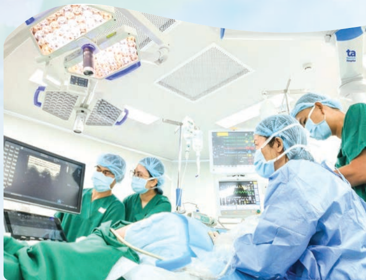
Nghị quyết 72 tạo đột phá chiến lược cho phát triển y tế tư nhân.

Y tế tư nhân là động lực đổi mới công nghệ và quản trị y tế. Các cơ sở tư nhân có khả năng huy động vốn nhanh, đầu tư trang thiết bị hiện đại, áp dụng công nghệ số, trí tuệ nhân tạo trong chẩn đoán, điều trị, quản lý bệnh án điện tử. Sự năng động của khu vực tư góp phần lan tỏa