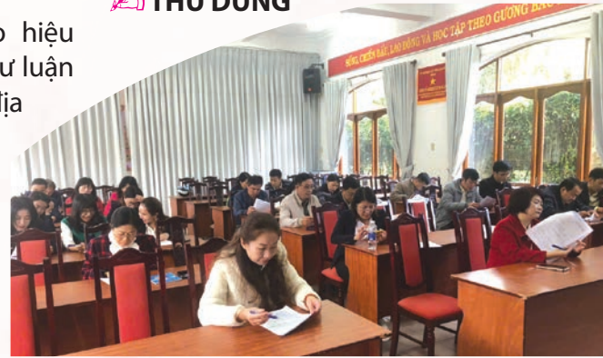
Cán bộ, công nhân viên Công ty Cổ phần dịch vụ đô thị Đà Lạt tham gia khảo sát đánh giá về kết quả Đại hội Đảng các cấp.

Kế hoạch được ban hành nhằm quán triệt, triển khai thực hiện nghiêm túc, hiệu quả Chỉ thị số 47-CT/TW, tạo sự chuyển biến mạnh mẽ, rõ nét về nhận thức và hành động của các cấp ủy, tổ chức đảng, chính quyền, Mặt trận Tổ quốc, các tổ chức chính trị - xã hội về vị trí, vai trò, tầm quan trọng của công tác dư luận xã hội (DLXH) trong tình hình mới. Đồng thời, nắm bắt kịp thời mong muốn, nguyện vọng chính đáng của các tầng lớp Nhân dân về những vấn đề, sự kiện có tính thời sự trong tỉnh, trong nước; kịp thời dự báo, phát hiện, xử lý những vấn đề phát sinh về chính trị, xã hội tại địa phương. Qua đó,