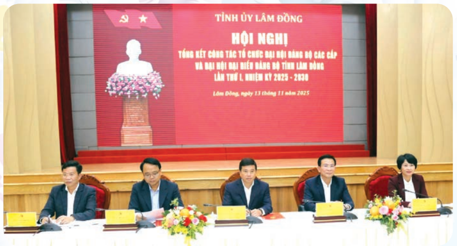
Các đồng chí trong Thường trực Tỉnh ủy Lâm Đồng chủ trì Hội nghị.

Ngày 13/11, Ban Thường vụ Tỉnh ủy Lâm Đồng tổ chức Hội nghị tổng kết công tác tổ chức đại hội Đảng bộ các cấp và Đại hội đại biểu Đảng bộ tỉnh lần thứ I, nhiệm kỳ 2025 - 2030.