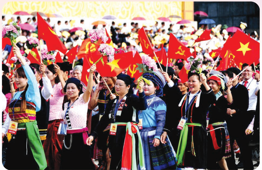
Việt Nam luôn nỗ lực không ngừng để thúc đẩy và bảo vệ quyền con người.

Quan điểm về quyền con người của Đảng Cộng sản Việt Nam đã được thể hiện nhất quán và liên tục trong các văn kiện pháp lý quan trọng qua các thời kỳ. Ngay từ Hiến pháp 1946, quyền lợi và nghĩa vụ công dân đã được quy định rõ ràng. Đặc biệt, Hiến pháp 2013 đánh dấu bước tiến vượt bậc, khẳng định “quyền con người, quyền công dân về chính trị, dân sự, kinh tế, văn hóa, xã hội được tôn trọng, thể hiện ở các quyền công dân và được quy định trong Hiến pháp và luật”. Đây thực sự là