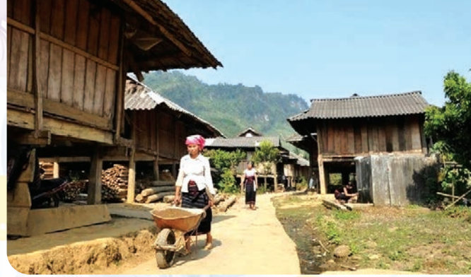
Nghị định quy định về đối tượng, nguyên tắc, tiêu chí và quy trình xác định các dân tộc còn gặp nhiều khó khăn, có khó khăn đặc thù giai đoạn 2026 - 2030.

- Cấp xã: Ủy ban nhân dân các xã, phường, đặc khu (sau đây gọi chung là Ủy ban nhân dân cấp xã) tổ chức rà soát thống kê số liệu về tổng dân số, tổng số hộ, số hộ nghèo, hộ cận nghèo của từng dân tộc tại địa bàn theo Mẫu số 01 ban hành kèm theo Nghị định này, gửi kết quả gồm 01 hồ sơ điện tử và 01 hồ sơ giấy về Ủy ban nhân dân tỉnh, thành phố (sau đây gọi chung là Ủy ban nhân dân cấp tỉnh) trong thời hạn 15 ngày làm việc kể từ ngày Ủy ban nhân dân cấp tỉnh chỉ đạo triển khai, tổ chức thực hiện. Trong đó: a) Số liệu rà soát về dân số của từng dân tộc tại địa bàn được thống kê theo dữ liệu quản lý dân cư trong vòng 15 ngày kể từ ngày Nghị định này có hiệu lực thi hành; b) Số liệu rà soát tổng số hộ, số hộ nghèo, hộ cận nghèo của từng dân tộc tại địa bàn được thống kê trên kết quả rà soát hộ nghèo, hộ cận nghèo năm 2024.