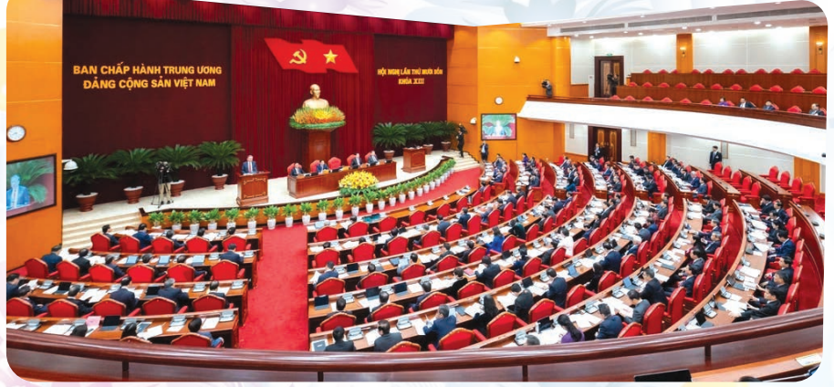
Toàn cảnh Hội nghị lần thứ 14 Ban Chấp hành Trung ương Đảng khóa XIII.

Thứ nhất: Ban Chấp hành Trung ương đã thảo luận dân chủ, kỹ lưỡng với sự nhất trí cao nhân sự giới thiệu tham gia Bộ Chính trị, Ban Bí thư khóa XIV. Ban Chấp hành Trung ương giao Bộ Chính trị và Tiểu ban nhân sự Đại hội XIV tiếp tục xem xét bổ sung, hoàn thiện các phương án nhân sự theo đúng phương hướng công tác nhân sự Ban Chấp hành Trung ương Đảng