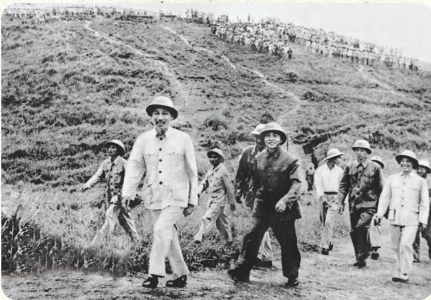
Bác Hồ là tấm gương sáng về nêu cao tinh thần trách nhiệm, hết lòng, hết sức phụng sự Tổ quốc, phục vụ Nhân dân.