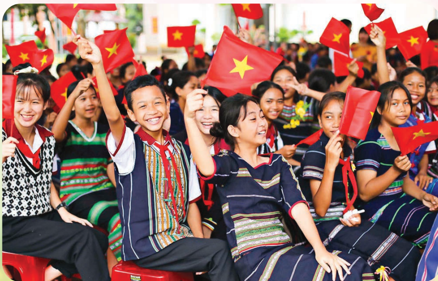
Học sinh Lâm Đồng nô nức trong ngày khai giảng năm học mới.

Đây là hành trình dài, đòi hỏi sự kiên trì và quyết tâm. Nhưng với định hướng chiến lược rõ ràng, cùng nỗ lực của toàn xã hội, giáo dục Việt Nam hoàn toàn có thể tạo nên những bước tiến mới, đóng góp quan trọng cho sự phát triển bền vững đất nước.