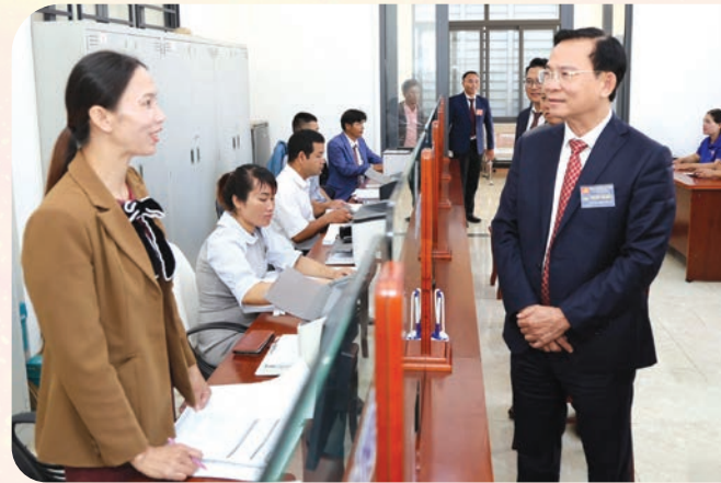
Đồng chí Hồ Văn Mười - Phó Bí thư Tỉnh ủy, Chủ tịch UBND tỉnh Lâm Đồng khảo sát tại Trung tâm phục vụ hành chính công xã Tà Đùng.

Phân cấp đúng đắn giúp mỗi cấp, mỗi ngành nắm vững tình hình cán bộ tại chỗ, từ đó phát hiện, bồi dưỡng, quy hoạch và sử