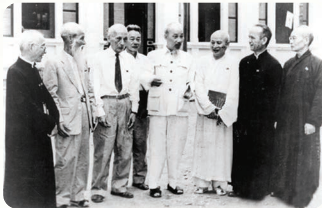
Chủ tịch Hồ Chí Minh nói chuyện thân mật với các đại biểu tôn giáo trong Quốc hội nước Việt Nam Dân chủ Cộng hòa năm 1960.

Sắc lệnh số 234/SL ngày 14/6/1955, với 5 chương, 16 điều khoản chi tiết về quyền tự do tín ngưỡng, tự do thờ cúng, quyền tham gia hoạt động xã hội của các Giáo hội. Sự quan tâm của Người còn thể hiện qua những hành động thiết thực, Người luôn dành thời gian gặp gỡ, nói chuyện, viết thư động viên