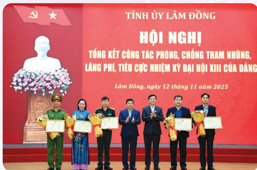
Tặng Bằng khen của Chủ tịch UBND tỉnh cho các tập thể có thành tích xuất sắc trong công tác PCTNLPTC.

Việc rà soát các công trình, dự án chậm tiến độ, tồn đọng,