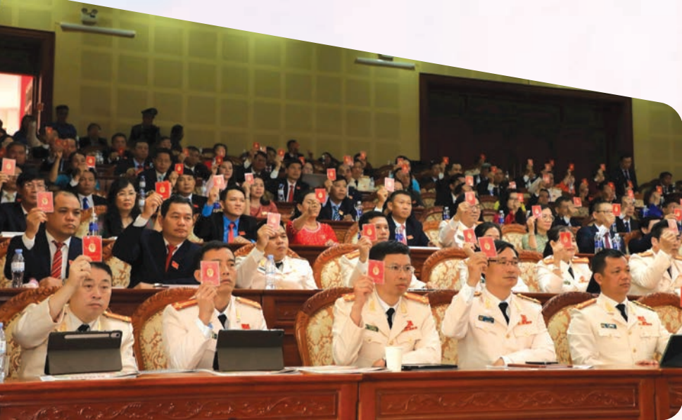
Đại biểu biểu quyết thông qua nghị quyết Đại hội đại biểu Đảng bộ tỉnh Lâm Đồng lần thứ I, nhiệm kỳ 2025 - 2030.

Ba là , công tác tuyên truyền về Nghị quyết Đại hội Đảng bộ tỉnh lần thứ I, nhiệm kỳ 2025 - 2030 cần được tiến hành thường xuyên, liên tục, toàn diện, đồng bộ, thống nhất với nhiều hình thức đa dạng, phong phú và phù hợp; bảo đảm đồng đều các tầng lớp Nhân dân đều được phổ biến, tuyên truyền về Nghị quyết Đại hội. Nội dung tuyên truyền tập trung về thành công của Đại hội, về những nội dung cốt lõi của Nghị quyết Đại hội Đảng bộ tỉnh lần thứ I; nhận diện đầy đủ những cơ hội, thuận lợi và khó khăn, thách thức trong những năm tới; chú trọng đấu tranh phản bác các quan điểm lệch lạc, sai trái, thù địch và định hướng dư luận xã hội theo phương châm “lấy xây làm chính”, “lấy tích cực đẩy lùi tiêu cực”. Đồng thời, thực hiện tốt công tác tuyên truyền Đại hội đại biểu toàn quốc lần thứ XIV của Đảng, công tác bầu cử đại biểu Quốc hội khoá XVI và đại biểu Hội đồng nhân dân các cấp nhiệm kỳ 2026 - 2031, bảo đảm tính thiết thực, hiệu quả.