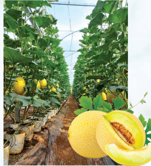
Trên địa bàn phường Bắc Gia Nghĩa hiện có 07 mô hình nhà lồng trồng dưa lưới với diện tích 22.500m 2 .

Tỉnh Lâm Đồng xác định một số định hướng trọng tâm, tăng cường sự lãnh đạo của cấp ủy, chính quyền các cấp, đưa mục tiêu bảo đảm an ninh lương thực vào chiến lược phát triển kinh tế - xã hội giai đoạn 2026 - 2030. Đẩy mạnh ứng dụng khoa học - công nghệ, chuyển đổi số và đổi mới sáng tạo, phát triển nông nghiệp xanh, kinh tế tuần hoàn, thích ứng biến đổi khí hậu. Đầu tư kết cấu hạ tầng nông nghiệp - nông thôn đồng bộ; đặc biệt, hệ thống thủy lợi, giao thông, logistics, bảo quản, chế biến, để giảm tổn thất sau thu hoạch. Phát triển nguồn nhân lực chất lượng cao, nhất là kỹ sư nông nghiệp, cán bộ khuyến nông, doanh nhân nông nghiệp và lao động trẻ nông thôn. Mở rộng hợp tác quốc tế, tham gia sâu vào chuỗi giá trị toàn cầu, nâng cao năng lực quản trị và sức cạnh tranh của nông sản Việt Nam.