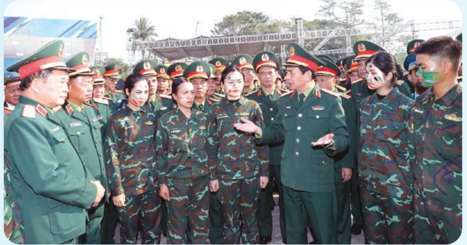
Đại tướng Phan Văn Giang, Bộ trưởng Bộ Quốc phòng trò chuyện với lực lượng đặc công tham gia biểu diễn phục vụ Triển lãm Quốc phòng quốc tế năm 2024.

Với yêu cầu giải phóng đất nước khỏi ách thống trị thực dân, phong kiến, quân đội ta nhanh chóng trưởng thành, hợp nhất các lực lượng vũ trang,