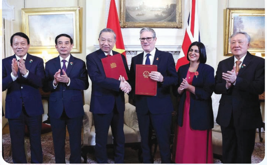
Hai nhà Lãnh đạo trao Tuyên bố chung về việc hai Bên chính thức nâng cấp quan hệ Việt Nam - Anh lên Đối tác chiến lược toàn diện.

Trước hết, dấu ấn nổi bật của chuyến thăm là việc Việt Nam và Anh nhất trí thiết lập quan hệ Đối tác chiến lược toàn diện, cấp quan hệ cao nhất trong hệ thống các khuôn khổ đối tác của Việt Nam. Trong Tuyên bố chung về xác lập tầm mức quan hệ mới, cũng như trong trao đổi, Tổng Bí thư Tô Lâm và các nhà lãnh đạo Anh đã thống nhất các biện pháp chiến lược, xác định các trụ cột hợp tác tương xứng với tầm mức mới của quan hệ song phương đó là: tăng cường hợp tác chính trị, ngoại giao, quốc