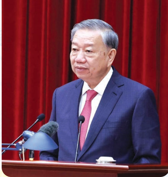
Tổng Bí thư Tô Lâm phát biểu bế mạc Hội nghị lần thứ 14 Ban Chấp hành Trung ương Đảng khóa XIII.

Đẩy mạnh cải cách thủ tục hành chính bảo đảm hiệu quả, phù hợp với mô hình chính quyền địa phương 2 cấp; đề xuất đến tổ chức, hoạt động của Mặt trận Tổ quốc, các tổ chức chính trị - xã hội, các hội quần chúng theo mô hình mới. Xây dựng cơ chế phối hợp linh hoạt, hiệu quả