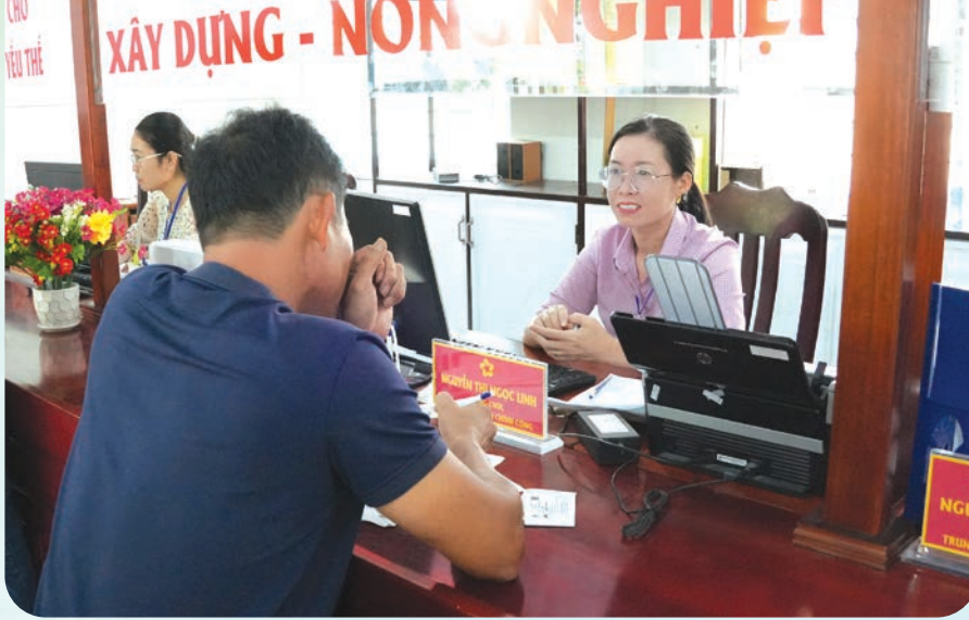
Cán bộ Trung tâm Hành chính công xã Nam Thành hướng dẫn người dân làm thủ tục hành chính. Ảnh. BLĐ