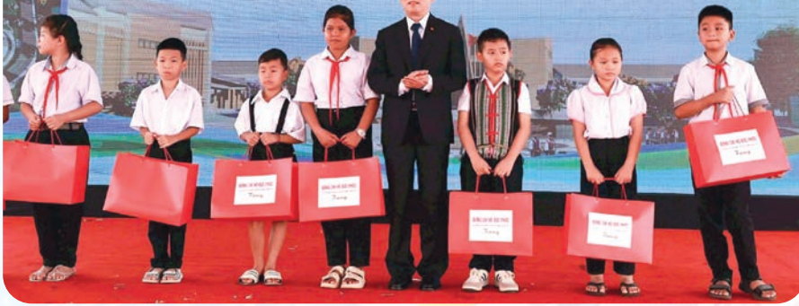
Phó Thủ tướng Hồ Đức Phúc trao tặng 10 suất quà cho học sinh nghèo vượt khó xã Thuận An.

phổ thông nội trú liên cấp tại khu vực biên giới là chủ trương lớn, mang ý nghĩa nhân văn sâu sắc, giúp học sinh vùng sâu, vùng xa có cơ hội tiếp cận tri thức mới và nền giáo dục tiên tiến.