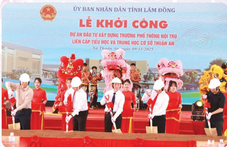
Phó Thủ tướng Hồ Đức Phớc, lãnh đạo Trung ương và tỉnh tiến hành động thổ khởi công Dự án xây dựng trường học tại xã biên giới Thuận An.

Phó Thủ tướng khẳng định, việc đầu tư xây dựng các trường