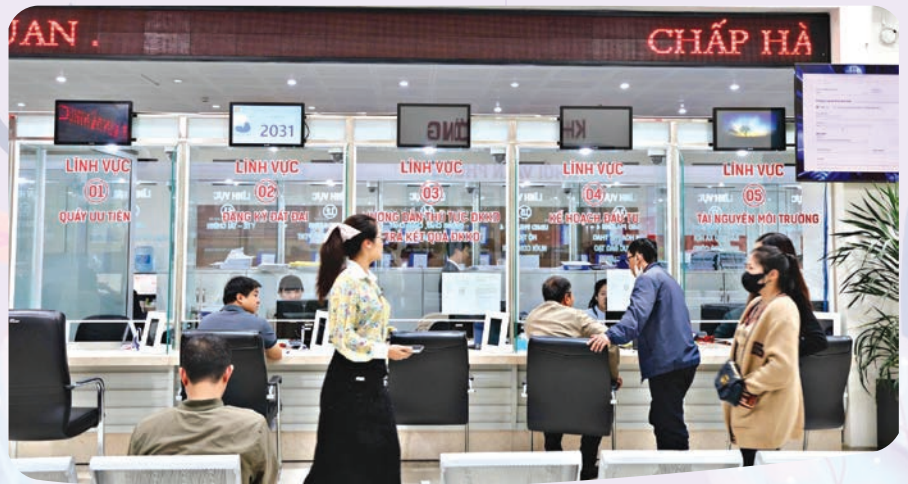
Người dân làm thủ tục hành chính tại Trung tâm Phục vụ hành chính công tỉnh Lâm Đồng.

Bên cạnh đó, công tác cải cách tài chính công, tăng tính tự chủ, minh bạch được quan tâm. Ngân sách nhà nước được phân bổ công khai, gắn với kết quả đầu ra. Tỉnh có 271 đơn vị sự nghiệp công lập, trong đó 83 đơn vị tự chủ chi thường xuyên và đầu tư. Công tác quản lý, sử dụng tài sản công được kiểm soát chặt chẽ; 111 cơ sở nhà, đất dôi dư được xử lý đúng