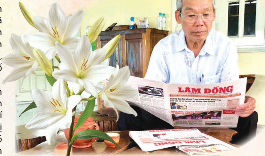
Báo Đảng địa phương - cầu nối quan trọng giữa Đảng với Nhân dân.

Bên cạnh những kết quả đạt được vẫn còn có một số hạn chế, bất cập như: Việc mua, đọc báo, tạp chí của Đảng tại một số chi bộ, đảng bộ chưa đầy đủ và thường xuyên, nhất là sau thời điểm sắp xếp tổ chức bộ máy chính quyền