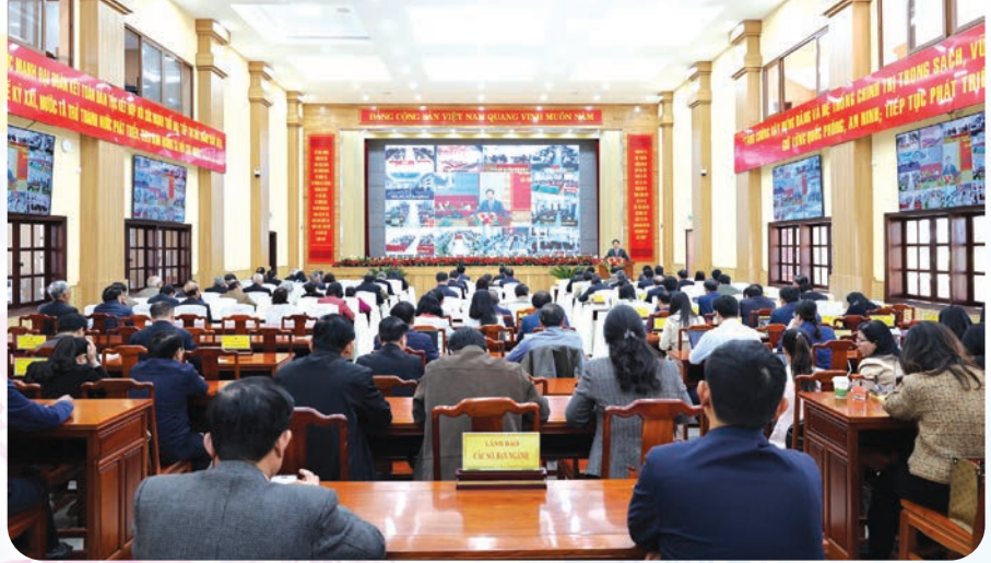
Quang cảnh Hội nghị tại Hội trường Tỉnh ủy.

Nghị quyết Đại hội đại biểu Đảng bộ tỉnh Lâm Đồng lần thứ I là kết tinh trí tuệ của toàn Đảng bộ, khát vọng phát triển của nhân dân các dân tộc trong tỉnh, thể hiện ý chí, niềm tin và quyết tâm chính trị cao của cả hệ thống chính trị của tỉnh trên chặng đường mới.