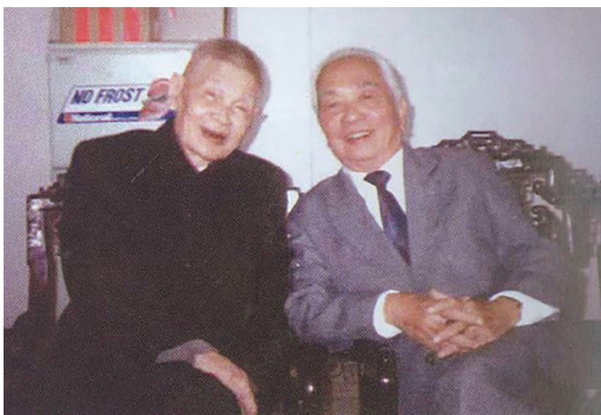
Đồng chí Lê Văn Lương và đồng chí Võ Nguyên Giáp.

Năm 15 tuổi (1927), đồng chí gia nhập Việt Nam Thanh niên Cách mạng đồng chí Hội, tổ chức tiền thân của Đảng; 17 tuổi, đồng chí được kết nạp vào Đảng Cộng sản Đông Dương;