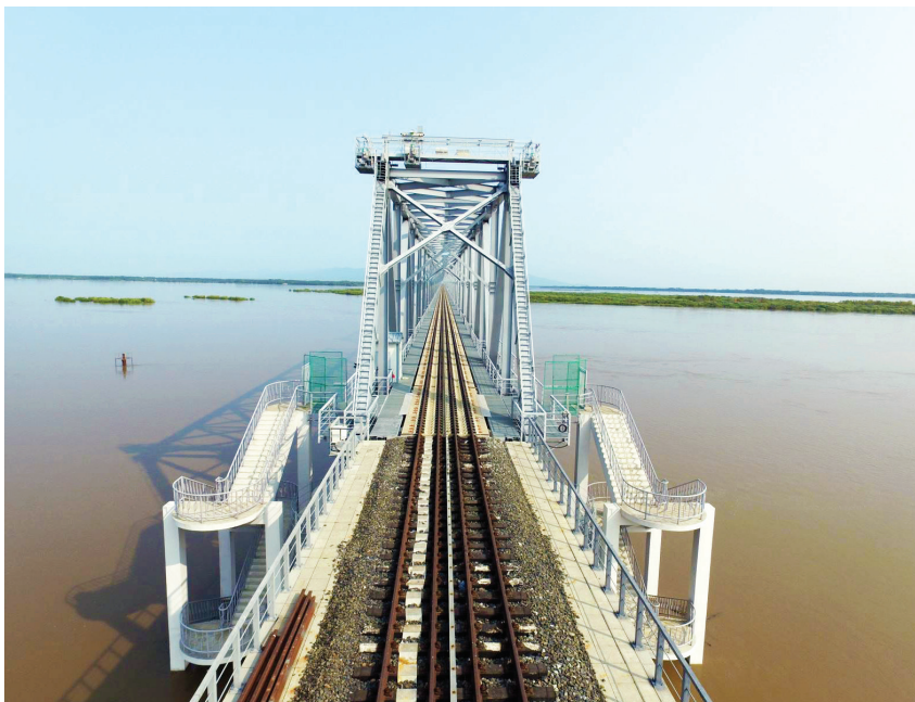
Cây cầu nối giữa Trung Quốc và Nga.

Việc hai nước ra Tuyên bố chung ủng hộ hình thành “một kiểu quan hệ mới giữa các