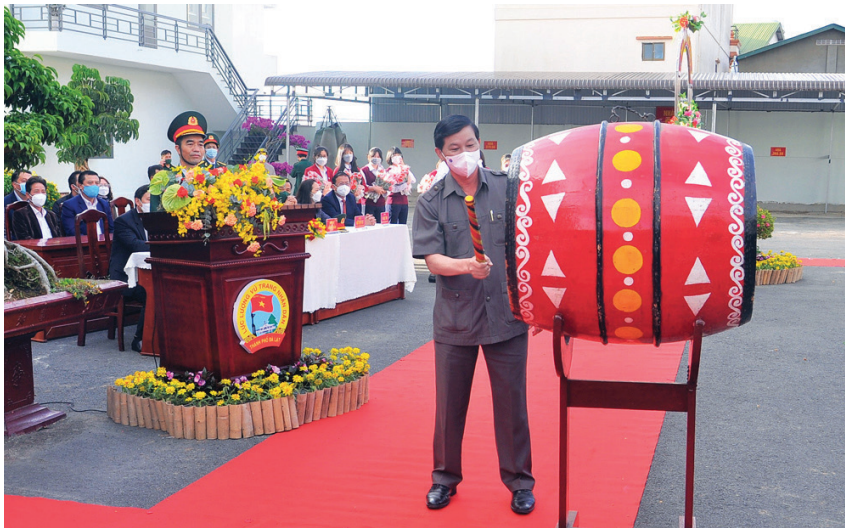
Đồng chí Trần Đức Quận - Ủy viên Ban Chấp hành Trung ương Đảng, Bí thư Tỉnh ủy, Chủ tịch HĐND tỉnh Lâm Đồng đánh trống giao quân

Năm 2022, tỉnh Lâm Đồng được giao chỉ tiêu tuyển chọn và gọi 1.150 công dân nam trong độ tuổi nhập ngũ. Tiêu chuẩn tuyển chọn, gọi công dân nhập ngũ được tiến hành theo Luật Nghĩa vụ Quân sự năm 2015; đảm bảo chỉ tiêu, chất lượng, đáp ứng yêu cầu xây dựng Quân đội trong tình hình mới; tạo nguồn cán bộ cơ sở cho các địa phương vùng sâu, vùng xa.