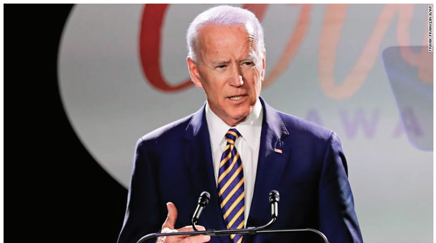
Tổng thống Mỹ Joe Biden trải qua năm đầu tiên với không ít thăng trầm.

Về đối ngoại, chính quyền của Tổng thống Joe Biden đã giành lại vai trò dẫn dắt của Mỹ trong nhiều vấn đề quốc tế như đảm bảo cung ứng vaccine, chống biến đổi khí hậu bằng việc đưa Hoa Kỳ quay lại một loạt khuôn khổ đa phương. Điển hình là việc khôi phục tư cách thành viên của Hoa Kỳ trong Tổ chức Y tế Thế giới (WHO); tái gia nhập Hiệp định Paris về biến đổi khí hậu... Bằng việc hàn gắn quan hệ đồng minh xuyên Đại Tây Dương với các đối tác lâu đời ở châu Âu, Tổng thống Joe Biden đã giải quyết những tranh chấp thương mại và thúc đẩy các giá trị chung. Hoa Kỳ cũng đã thiết lập cơ chế hợp tác Australia - Anh - Hoa Kỳ (AUKUS) và nâng tầm ảnh hưởng tại khu vực Ấn Độ Dương - Thái Bình Dương. Mặt khác, quyết định rút toàn bộ quân đội Mỹ khỏi Afghanistan