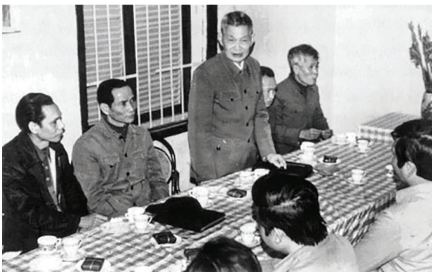
Đồng chí Lê Văn Lương tại lễ công bố Quyết định thành lập Nhà xuất bản Hà Nội, ngày 24/11/1979.