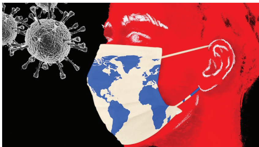
Đại dịch Covid-19 thách thức kinh tế nghiêm trọng tới kinh tế toàn cầu.

Tuy nhiên, một số quan điểm khác cho rằng, với sự ra đời của các biến chủng mới và sự bất bình đẳng trong việc phân phối vaccine tiếp tục là trở ngại cho sự kết thúc đại dịch Covid-19. Năm 2022, thế giới