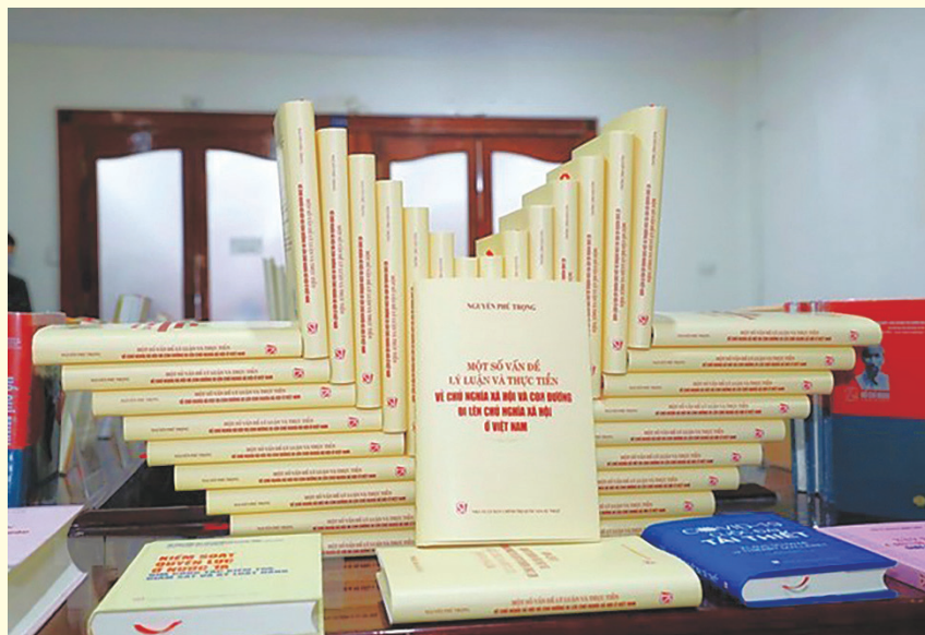
Cuốn sách Một số vấn đề lý luận và thực tiễn về chủ nghĩa xã hội và con đường đi lên chủ nghĩa xã hội ở Việt Nam