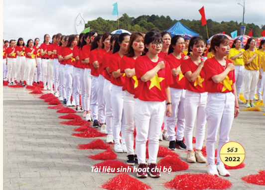
Tài liệu sinh hoạt chi bộ

Ngày thành lập Đoàn TNCS Hồ Chí Minh 26/3