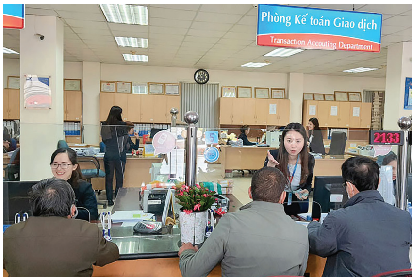
Đội ngũ công nhân viên Vietinbank Lâm Đồng luôn nêu cao tinh thần trách nhiệm trong giao tiếp với khách hàng.

Nhờ đó, việc học và làm theo Bác tại chi nhánh không còn là khẩu hiệu, là sự hô hào, mà đã được Đảng ủy, Ban