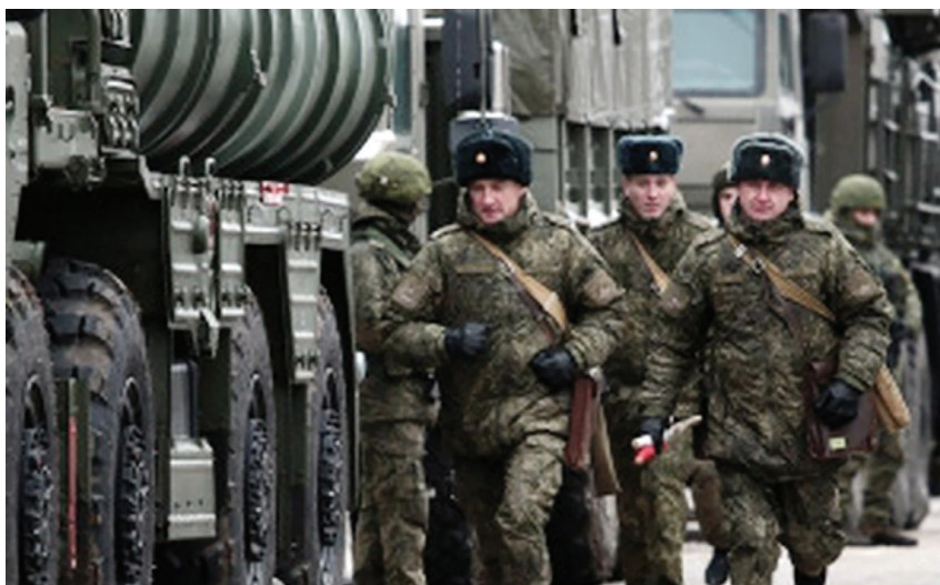
Nga vẫn tiếp tục tăng cường hiện diện quân sự tại khu vực gần biên giới với Ukraine. Ảnh: K.T

Trước những căng thẳng giữa Nga và Ukraine, hầu hết các nhà phân tích đều cho rằng, một cuộc chiến quy mô lớn giữa Nga và Ukraine ít có khả năng xảy ra do các bên đều hiểu hậu quả của một cuộc xung đột nếu xảy ra là rất lớn. Cuộc khủng hoảng Ukraine thể hiện điều cốt lõi trong quan hệ quốc tế là vấn đề địa chính trị và xu thế tập hợp lực lượng. Lập trường quyết đoán của Nga trước hết nhằm mục đích buộc Hoa Kỳ và các đồng minh NATO phải đàm phán lại cấu trúc an ninh châu Âu, đặc biệt là khu vực ảnh hưởng của Liên