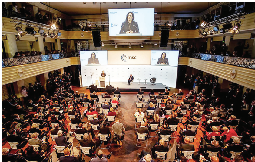
Phó Tổng thống Mỹ Kamala Harris phát biểu trong Hội nghị An ninh Munich ở Munich, Đức, ngày 19/2.

Phó Tổng thống Mỹ Mike Pence nhắc lại cam kết của