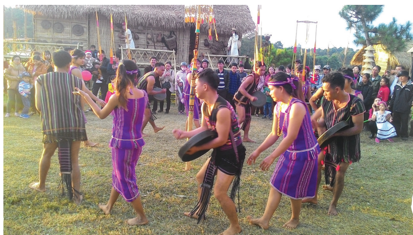
Biểu diễn công chiêng tại Lễ hội Festival Hoa Đà Lạt lần thứ VIII phục vụ du khách.

Từ các nghị quyết của Đảng về văn hóa, Chính phủ đã cụ thể hóa bằng các chính sách, chiến lược như: “Chiến lược phát