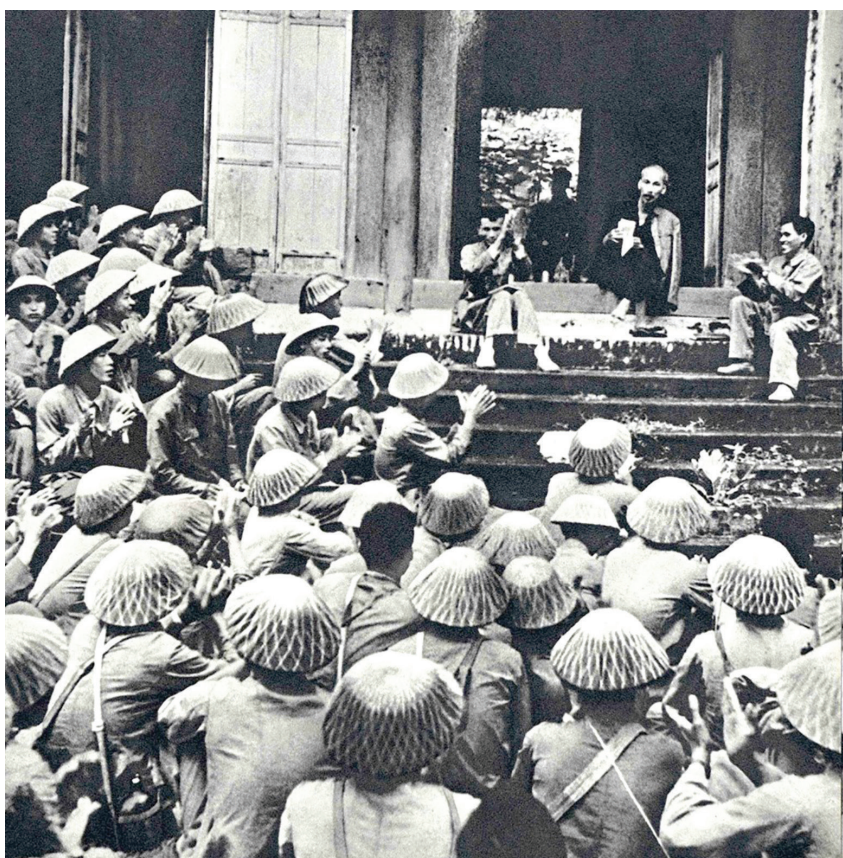
Bác Hồ với Đại đoàn quân tiên phong tại Phú Thọ.

Tư tưởng của Người về khuyến học, khuyến tài, xây dựng xã hội học tập (XHHT) là một hệ thống các quan điểm mang tính lý luận và thực tiễn sâu sắc. Người để lại một di sản vô cùng quý báu cho Đảng, cho Nhân dân ta những bài học lớn, giản dị mà sâu sắc, cả cuộc đời của Bác chỉ có một hoài bão và tâm tư: “Tôi chỉ có một ham muốn, ham muốn tột bậc, là làm sao cho nước ta được hoàn toàn độc lập, dân ta được hoàn toàn tự do, đồng bào ai cũng có cơm ăn, áo mặc, ai cũng được học hành”. Mục tiêu vừa là khát vọng “Ai cũng được học hành”