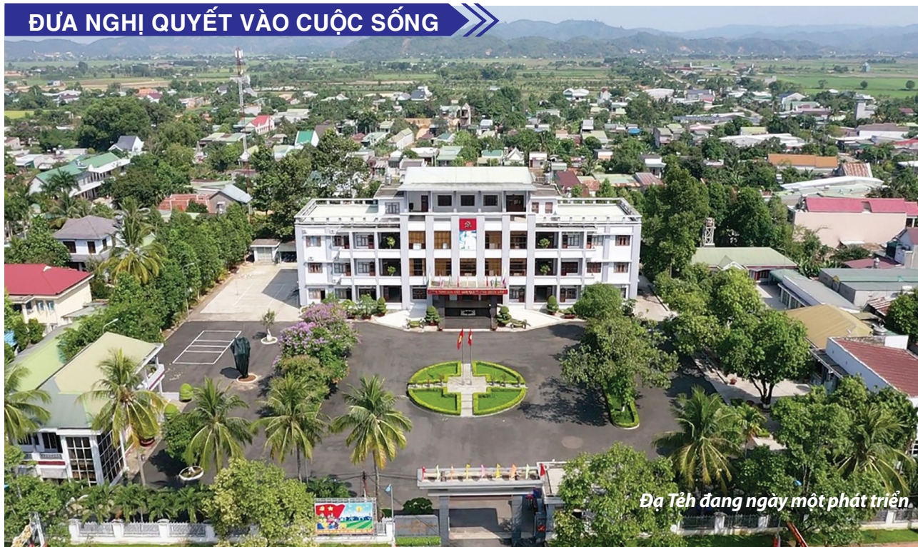
Đà Tẻ đang ngày một phát triển.