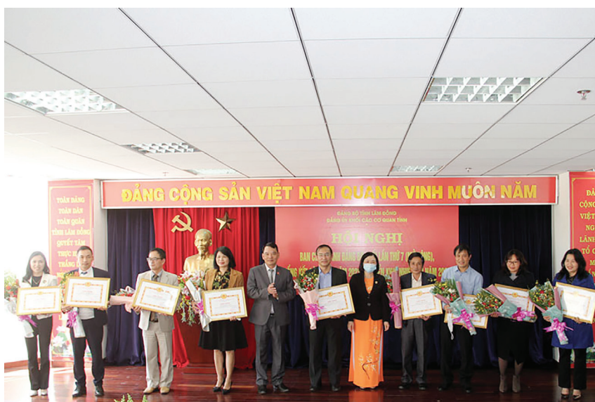
Đảng bộ Trường CĐSP Đà Lạt là một trong những TCCS Đảng được BTV Đảng ủy Khối các cơ quan tỉnh khen thưởng trong công tác XDĐ năm 2021

Cùng với việc triển khai học tập, quán triệt các chỉ thị, nghị quyết của Đảng, chính sách, pháp luật của Nhà nước, Đảng ủy luôn quan tâm đến việc học tập, quán triệt các quy định, hướng dẫn về công tác kiểm tra, giám sát và thi hành