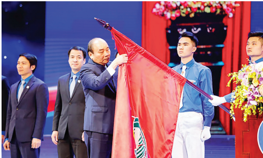
Thủ tướng Chính phủ Nguyễn Xuân Phúc gắn Huân chương Hồ Chí Minh lên cờ Đoàn.

Năm 1911 người thanh niên yêu nước Nguyễn Tất Thành từ bến cảng Nhà Rồng ra đi tìm đường cứu nước. Người đã sáng lập, lãnh đạo và rèn luyện Đoàn Thanh niên Cộng sản ở nước ta. Sự ra đời của Đoàn Thanh niên Cộng sản ở Việt Nam trở thành một dấu mốc lịch sử trọng đại của thế hệ trẻ Việt Nam, từ đây những người cộng sản trẻ tuổi đã có tổ chức riêng của mình đặt dưới sự lãnh đạo, rèn luyện thường xuyên, trực tiếp, toàn diện về mọi mặt của Đảng; luôn sắt son niềm tin với Đảng, trở thành đội dự bị tin cậy của Đảng, lực lượng đông đảo, đội quân xung kích cách mạng, trường học xã hội chủ nghĩa của thanh niên Việt Nam; luôn phấn đấu vì mục tiêu, lý tưởng của Đảng là độc lập dân