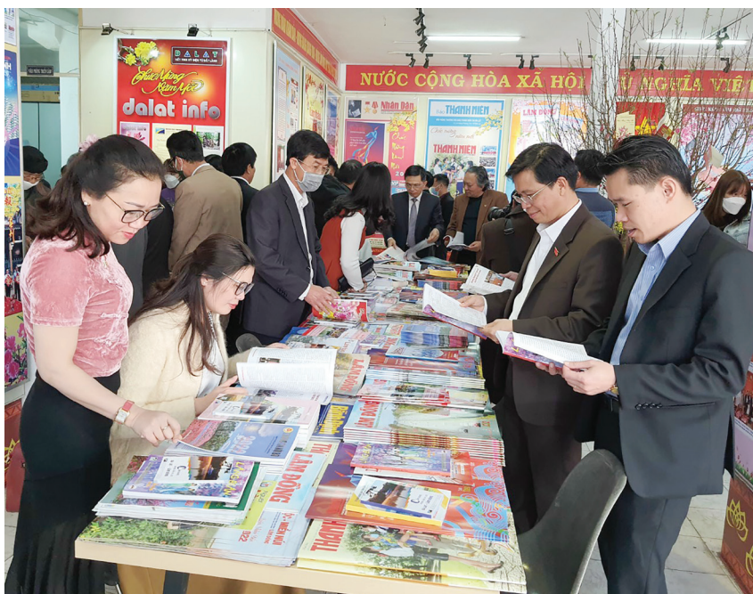
Các đại biểu đến dự lễ khai mạc, tham quan và đọc Báo Xuân.

Tại điểm Nhà thông tin - Triển lãm Khu Hòa Bình thành phố Đà Lạt đã giới thiệu hơn 80 loại báo, tạp chí, ấn phẩm Xuân của Trung ương, địa phương và của ngành với hơn 250 tờ, trong đó, tài liệu của thư viện tỉnh Lâm Đồng 72 loại báo, 83 tạp chí, 114 cuốn sách về chủ đề Xuân; đặc biệt là Hội Văn học Nghệ thuật tỉnh trưng bày giới thiệu 24 tác phẩm ảnh nghệ thuật với chủ đề “Việt Nam muôn màu”,