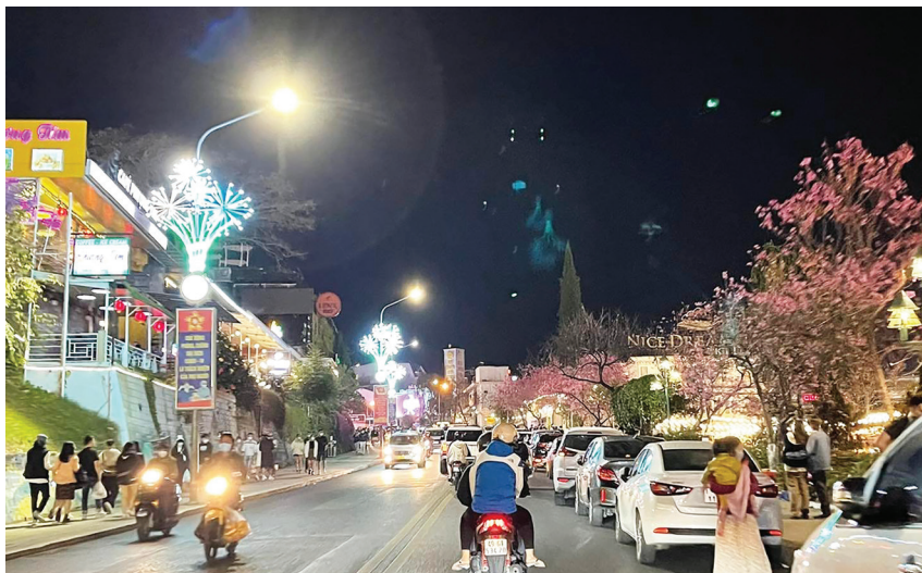
Lượng du khách tới Lâm Đồng Tết Nhâm Dần tăng trên 566% so với cùng kỳ Tết Nguyên đán Tân Sửu.

Với việc quán triệt các văn bản của Trung ương, Ban Thường vụ Tỉnh ủy đã có công văn 1121-CV/TU, ngày 14/12/2021 về việc tổ chức Tết Nhâm Dần năm 2022, trong đó yêu cầu các cấp ủy, chính quyền, Mặt trận Tổ quốc và các tổ chức chính trị-xã hội tập trung lãnh đạo, chỉ đạo, chuẩn bị tốt các điều kiện phục vụ Nhân dân đón mừng năm mới 2022 và vui Xuân, đón Tết Nguyên đán Nhâm Dần lành mạnh, an toàn, tiết kiệm, tạo khí thế quyết tâm thực hiện thắng lợi Nghị quyết Đại hội Đại biểu toàn quốc