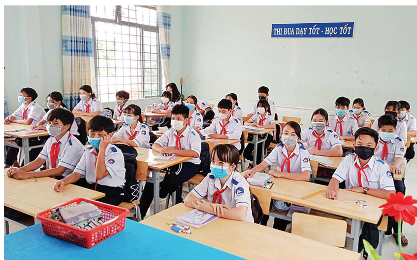
Giờ dạy học trực tiếp tại điểm trường Trường THCS&THPT Lê Quý Đôn, Đạ Tẻh, tỉnh Lâm Đồng.

Công tác chuẩn bị cho học sinh, sinh viên đến trường học trực tiếp được Chính phủ, Bộ Giáo dục và Đào tạo quan tâm và chỉ đạo quyết liệt: