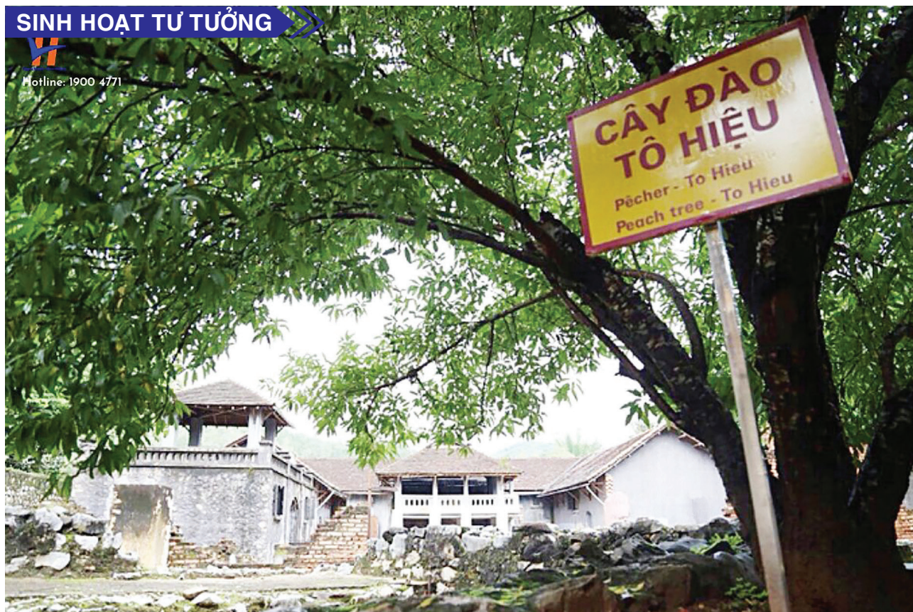
Cây đào Tô Hiệu tại khu Di tích Nhà tù Sơn La.